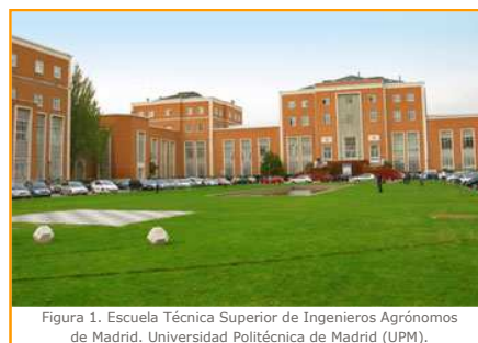
Figura 1. Escuela Técnica Superior de Ingenieros Agrónomos de Madrid. Universidad Politécnica de Madrid (UPM).

En la actualidad, las Universidades españolas están inmersas en un proceso de transformación y modernización para la adecuación de sus enseñanzas al entorno Europeo, proceso que ha convenido llamarse de construcción del Espacio Europeo de Educación Superior, o de 'adaptación al plan de Bolonia'. La ordenación de las enseñanzas está regulada por el Real Decreto 1393/2007, que sienta las bases para la elaboración de nuevos planes de estudios. El análisis crítico de la situación de partida y de las necesidades de la sociedad resulta indispensable para la propuesta de nuevas materias y el diseño de sus contenidos.