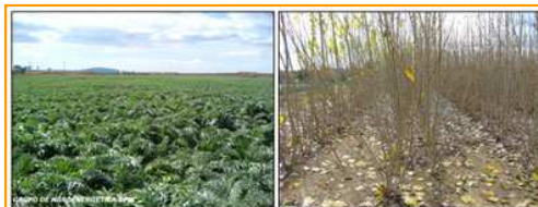
Figura 3. Ejemplo de dos cultivos energéticos. Izquierda: Cynara en estado de roseta (Cynara cardunculus L.). Derecha: Chopo cultivado en corta rotación en el estado de reposo invernal (Populus spp.).

En relación a los cultivos energéticos, cuyo tratamiento específico debería ser propio de los estudios de Ingeniero Agrónomo e Ingeniero Técnico Agrícola, los datos de este estudio muestran que todavía no hay asignaturas con programas dedicados exclusivamente a los cultivos energéticos. No obstante, el 50% de los programas analizados de esas titulaciones dedican temas a este campo de la Biomasa. Este hecho se interpreta como reflejo de la escasísima penetración de los cultivos energéticos en el sector productor. Asimismo, no responde a las previsiones de implantación de cultivos energéticos señaladas en el PER de España, ni a las expectativas de promoción de la Biomasa en el espíritu de la Directiva 2009/28/CE, lo cual evidencia la necesidad de implementar medidas al respecto.